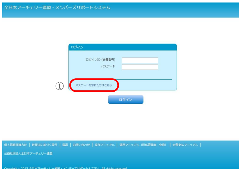
図 1-1 ログイン画面