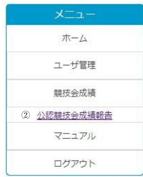
図 3-1 メニュー（一般）