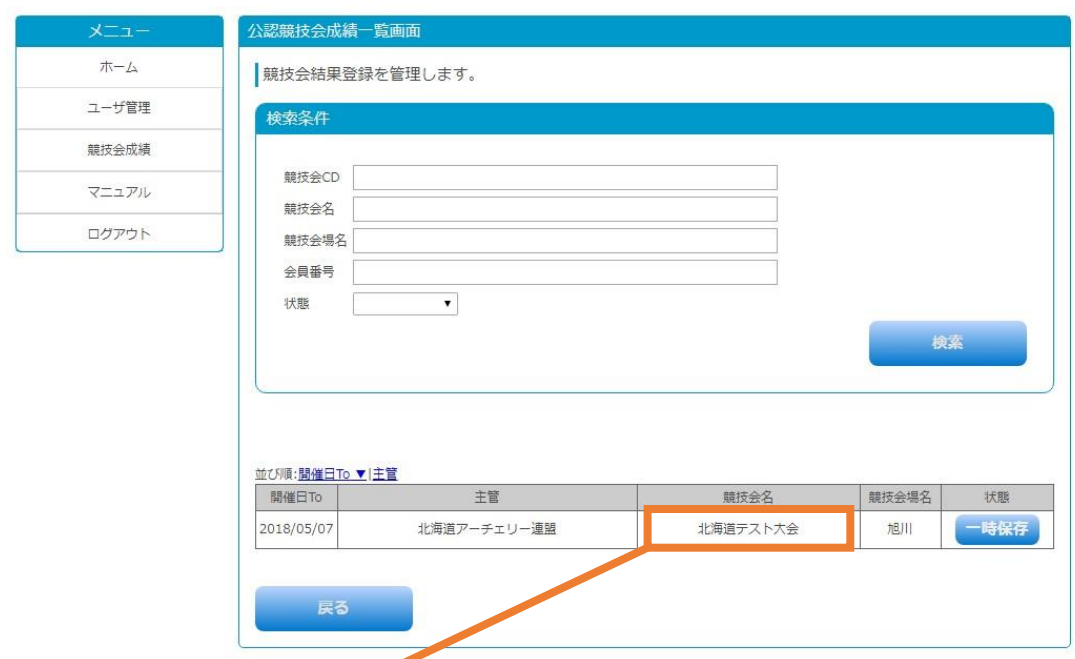
図 3-2 公認競技会成績一覧画面