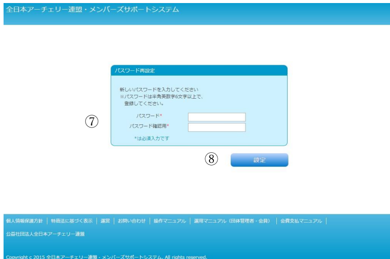
図 1-6 パスワード設定画面