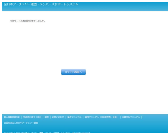
図 1-7 パスワード設定完了画面